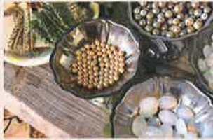
アイデアノート idea note (近江八幡)

アンティークやビンテージの手芸用品と雑貨 近江八幡の旧市街地で、手芸と雑貨とヴィンテージのお店をしております。国内外のヴィンテージやアンティークの手芸パーツや滋賀県産の伝統ある素材や、滋賀の作家による手作り作品を取り扱っています。今回は、お得なパーツセットや毛糸をご用意いたします。