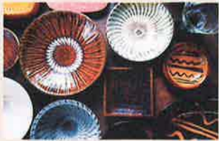
コイコイ商店 (京都) ワークショップあり

焼き物 (小鹿田焼、丹波立杭焼、布志名焼、伊賀焼)、手吹きガラス、木工、竹細工、鬼風の絵付け体験 京都・西陣で小さな民藝店をしています。日本中で見つけ、買い付けた民藝品を中心に、職人さんの手仕事を通して、人と人、人とモノ、その先に見えるコトを繋いでいけたらと考えています。皆さまの日常生活の中での「豊かさ」を見出すお手伝いができれば幸いです。