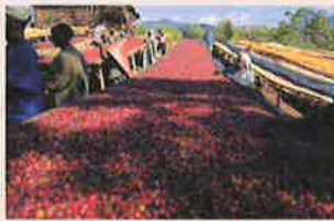
マナコペ Manakope (草津)

エチオピア、グジ・ゲイシャ、ジャスミンG1 (アイス・ホット) 300円 エチオピアゲイシャ種になります。規格はG1完熟した豆を使いフルーラルな香りが広がり、すっきりといてグリーンな口当たりのコーヒーになります。 草津市の鮮度と品質に拘った小さな珈琲焙煎所です。新鮮で美味しいコーヒーを提供しております。