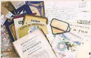
ランプバベロプロカント 紙もの雑貨とヴィンテージ Lamp×Paperi Brocante (京都)

古い時代 (主にヨーロッパ) の書類、楽譜、カード、古書などが中心。一部オリジナル紙もの雑貨 (ラベル、スタンプなど) あり デザインが素敵な書類、カード、楽譜、古書などヨーロッパの古い時代の「紙もの」とフレンチシックなデザインのオリジナル文具を国内外に販売。京都北白川にあるアトリエを拠点に活動しています。