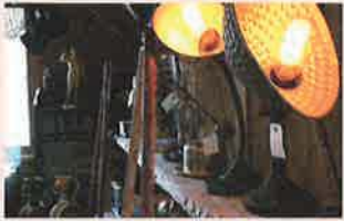
カフェワピ café wapi (信楽)

レディース、メンズ古着、ちょっとクセのある一点物のヴィンテージ雑貨など 信楽で火・水・木曜の週3日間、フレンチトーストとコーヒーの喫茶店を営んでいます。時を経た様々な照明や調度品に囲まれた大人の隠れ家で、特別な時間をお過ごしいただけます。今回は古着を中心に、照明などのヴィンテージ雑貨をご用意いたします。