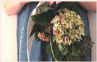
ハヤコフラワーデザイン おうちに花とハナウタを Hayako Flower Design (守山) ワークショップあり

生花 (贈りたくなるミニブーケ)、ドライフラワー (飾りたくなるスワッグ)、花器、クリスマス雑貨 季節のお花やグリーンをたっぷり使ったParisスタイルのブーケ、アレンジのレッスングリーンズワッグのワークショップを開催しています。今回は人気のグリーンズワッグや思わず贈りたくなるプチブーケをたくさんご用意します。ぜひ遊びにきてください。