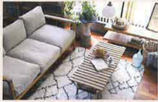
アデペシュ a.dépêche (草津)

チェアー、テーブル、ソファなど テイストは「パリのアパートメントの一室」をイメージし、国籍や人種、色味、素材に偏った固定観念を持つことなく、ミックス・コーディネート出来るa.dépêcheのファニチャー。今回は、そのオリジナルファニチャーのアウトレットSALEを行います！狙っていた一品がお得に手に入るかも？！掘り出しものを探して是非お越しください。