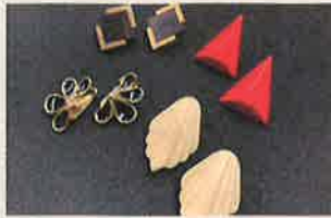
バックステージ >>>BACKSTAGE (草津)

ヴィンテージ洋品、ハット、ストール、バッグ、ポーチ、ソックス、アクセサリー JR 草津駅東口のユニセックスなセレクトショップ。老若男女に着用いただける、エイジレス、ジェンダーレスなアイテムが揃います。今回はバックステージのお洋服やハット、バッグ、ソックスに加え、アーカイブコレクションとしてヴィンテージのお洋服やアクセサリーも登場します。