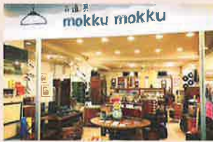
モックモック 古道具 mokkumokku (岐阜)

ビンパッチ・ステッカーなどの小物、本箱、本棚、食器棚、ガラスケース 岐阜県岐阜市のアーケード柳ヶ瀬商店街にある古道具屋。昭和の大型家具を中心に、捨てられてしまうはずだった家具を見つけ出し次の世代へ繋ぎます。