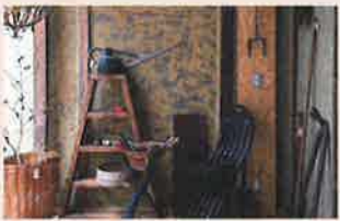
アンティークトット antique totto (大阪)

ヨーロッパ各地からセレクトしたアンティーク雑貨や古道具 大阪にある築90年の長屋にて、イギリスやベルギーを中心にヨーロッパ各地からセレクトしたアンティーク雑貨や古道具などを販売しています。