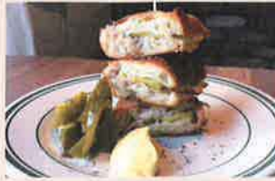
ビストロ ロンロママン (草津)

キューバサンド 600円 リエット 650円 フランスの大衆食堂「ブション」のような家庭的で気取らない田舎料理と自家製加工肉のお店。既製品を使わず、有機にこだわった食材と自然派ワインが当店の自慢です。