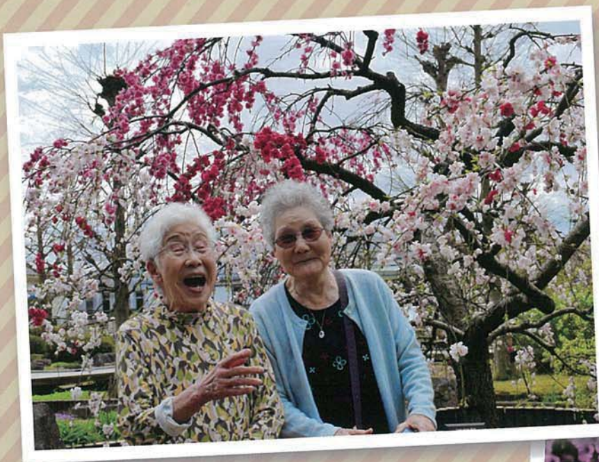
昨年度草津市長賞