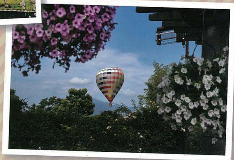
昨年度みずの森園長賞