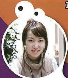
クサツハロウィン2018公式PRアーティスト