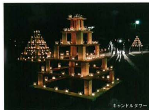
キャンドルタワー