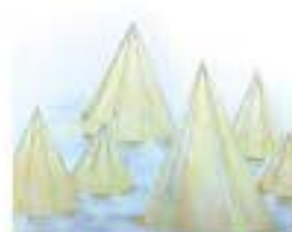
大阪工業大学 空間デザイン学科 チーム名：かさや 光明寺

「灯り」をキーワードに芸術センス溢れる空間創出の競演！そのテーマは出展者によって異なりますが、皆さんに感じて欲しいのは街の魅力と灯りがどうコラボレーションしているか？という視点です。評論家になった気分アート巡りをしてください。 会場には出展者が控えていますので、それぞれの「灯り」のトークをお楽しみください！