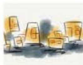
京都工芸繊維大学 チーム名：明明 立木神社

誰かがいることで生まれる「あかり」。浄教寺全体があたたかくほっとした空間に加えられる作品をつくりたい。