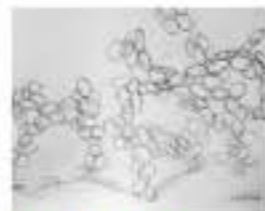
京都造形芸術大学 チーム名：こつはな 小沙井神社

様々な人や地域、企業との関わりの中で発展してきた草津市。各店舗から届けるロウソクの光はそれぞれに揺らめき、影が重なる。一つひとつの個性が関わり合う様子を表現しました。