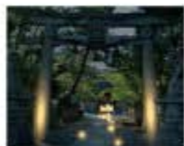
京都工芸繊維大学 チーム名：でんき組 . inc 立木神社

草津市は京阪神のベッドタウンとして人口増加が続いています。ベッドタウンの機能を果たすだけでなく市の内側からの賑わいを創り出す。これからの草津市を表現します。