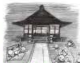
滋賀大学教育学部 チーム名：shigirl 正定寺