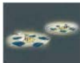
京都精華大学 チーム名：くららん 浄教寺

人生での困難な道のりをあかりの連続で表現し、ゴールを明るい未来にする。出展者が参加して作るあかりです。